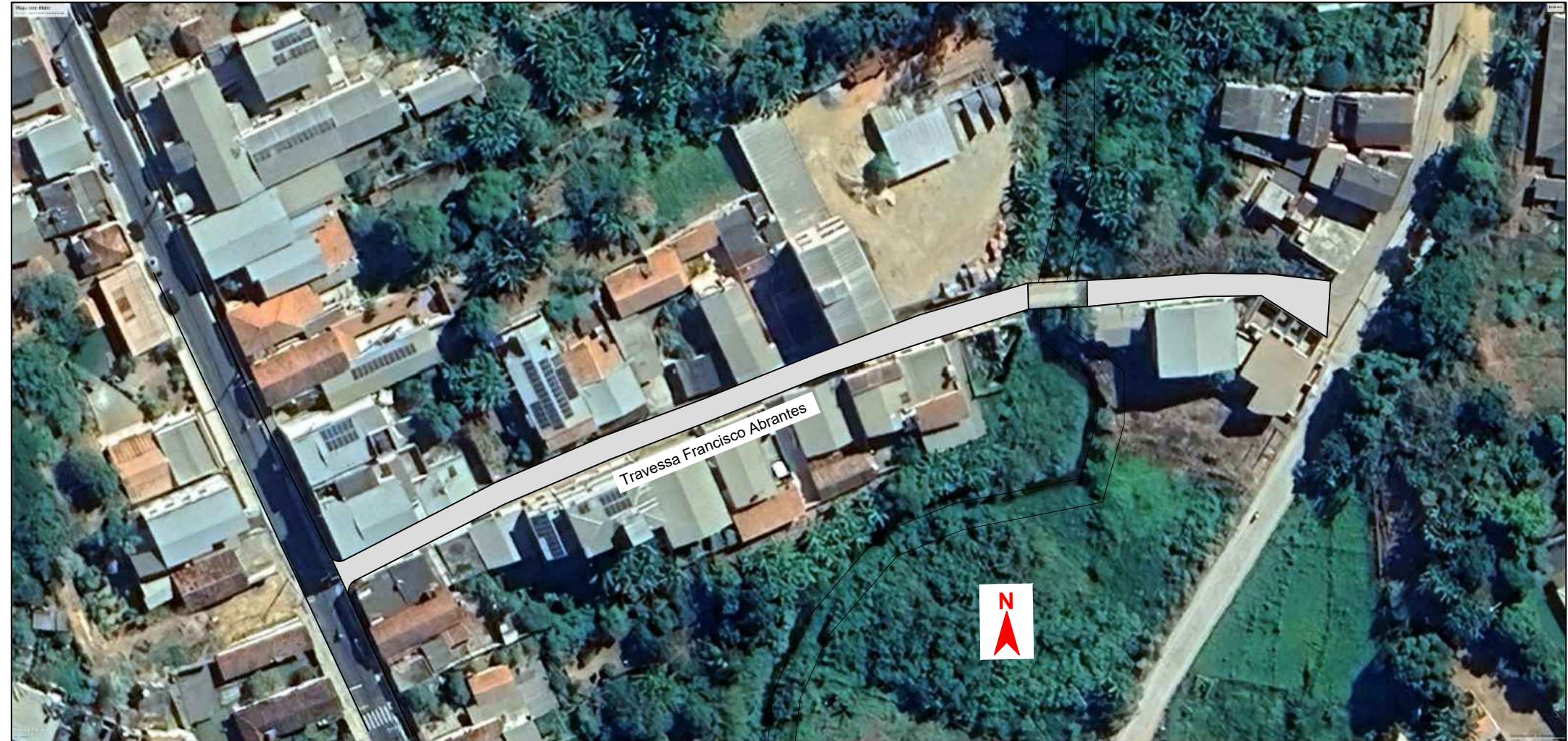
PLANTA DE LOCALIZAÇÃO Escala: 1/1000